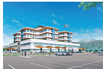
▲南西側からの目線高のイメージ図

現段階では、あくまで想定スケジュールですので、今後、昨今の建設資材の調達リードタイムの長期化や、働き方改革の影響等、建設市況を踏まえスケジュールの見直しを行う予定です。