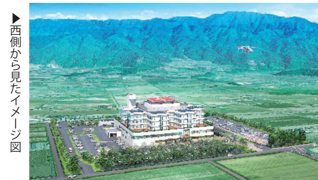
▶西側から見たイメージ図

基本計画を基に設計会社が想定するイメージ図です。あくまで基本設計初期段階での建物などのイメージですので、今後、設計内容に応じて変わります。