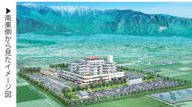
▶南東側から見たイメージ図